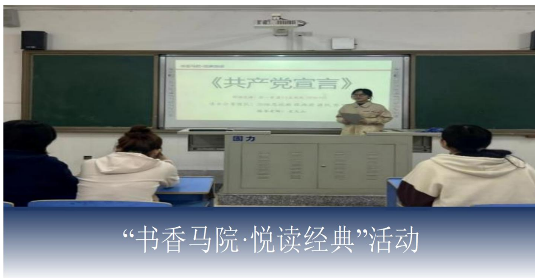
“书香马院·悦读经典”活动

坚持信仰铸魂，本专业学生的政治素养得到全面提升，95%以上学生递交了入党申请书，积极向党组织靠拢。