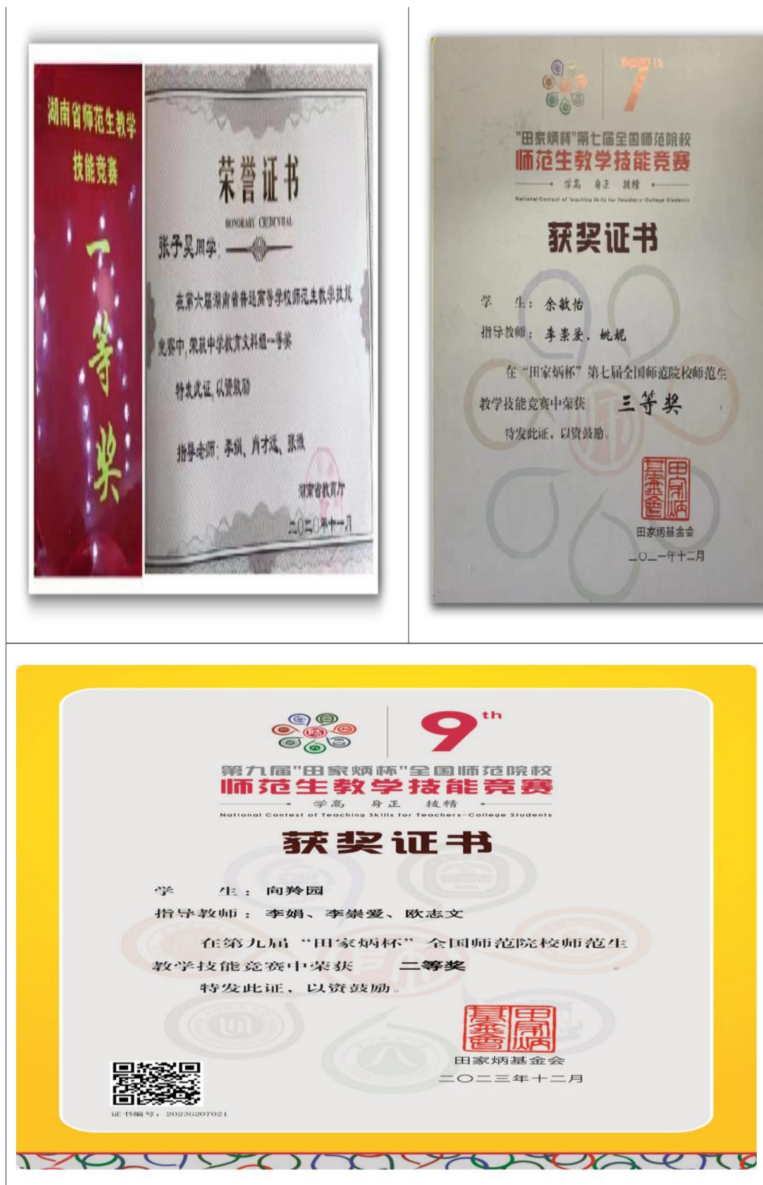
图五 马克思主义学院学生师范教学技能竞赛部分获奖展示