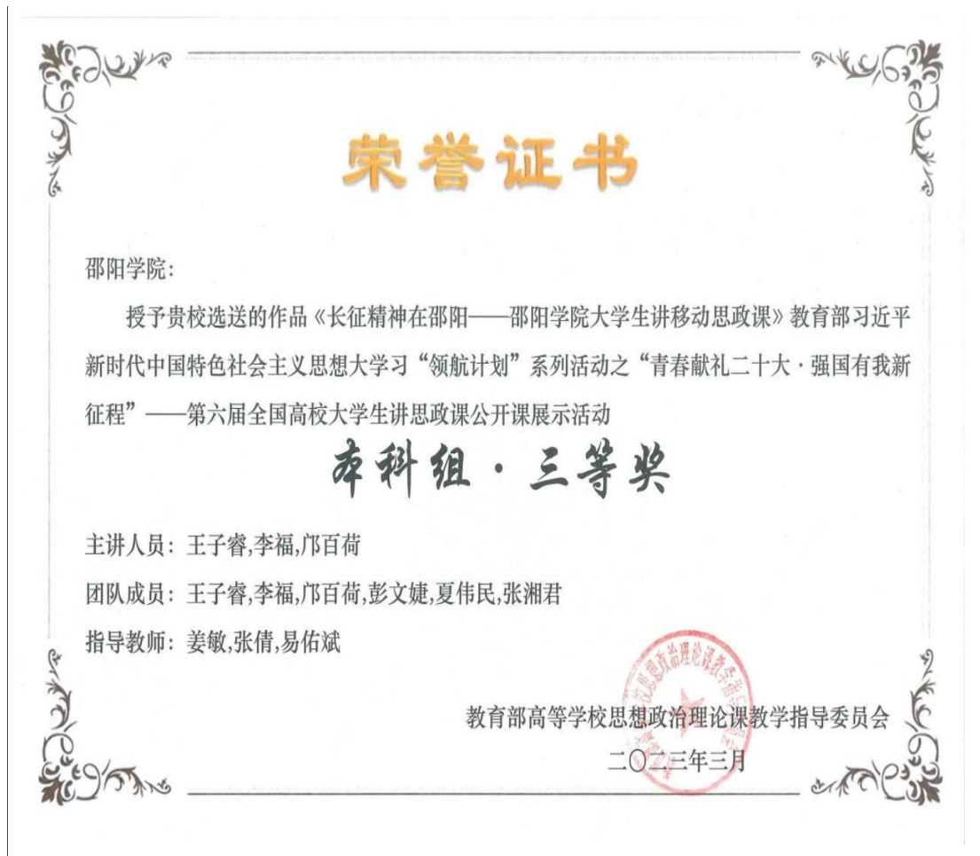
图三 马克思主义学院学生实践活动部分获奖展示