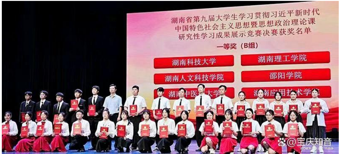
图八 学生“思政课研究性学习成果展示”竞赛部分获奖展示