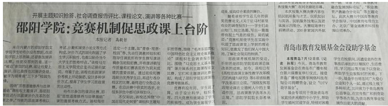
图五 省教学成果三等奖及中国教育报、光明网报道