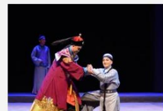
新编粤剧《十三行》广州首演