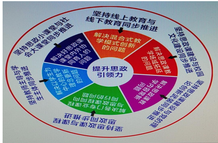
以“六个同步推进”提高思政引领力效果图