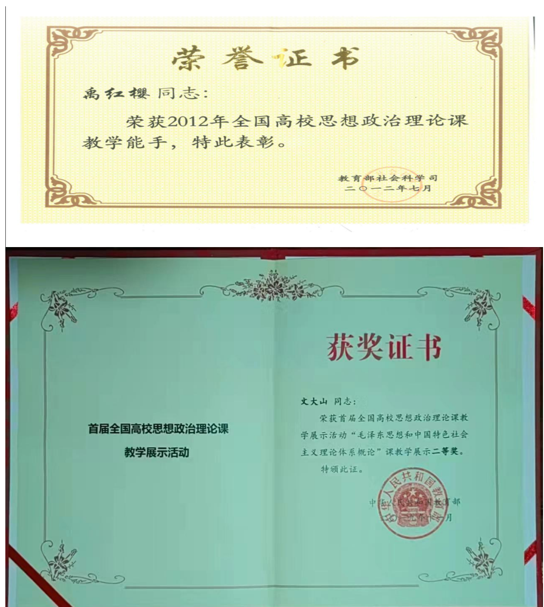
图三 马克思主义学院教师教学竞赛部分获奖展示

主观能动作用，开展研究式、讨论式、参与式教学，学生在第六届全国高校大学生讲思政课公开课展示活动中荣获本科组三等奖；坚持探索“双主”统一的教改实践，形成了理论支撑强、实践基础实、教改模式新、实施效果优、推广反响好的高校思政课主导性与主体性相统一的“1234”教改模式，主持了以教育部课题为核心的相关教改课题 20 多项，构建了主导性和主体性相统一的教改问题研究矩阵，出版了教改专著 6 部，发表了相关教改论文 40 多篇，荣获第十三届湖南省高等教育教学成果三等奖。教师主导与学生主体的同步推进，实现了教师乐教善教、学生乐学会学的良性互动局面。