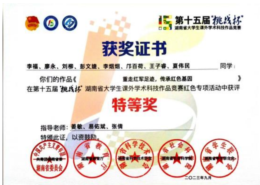
图七 马克思主义学院学生“挑战杯”竞赛部分获奖展示