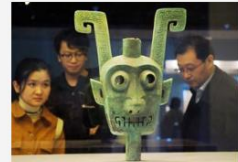
“望郡吉安”文物精品展首都博物馆开展