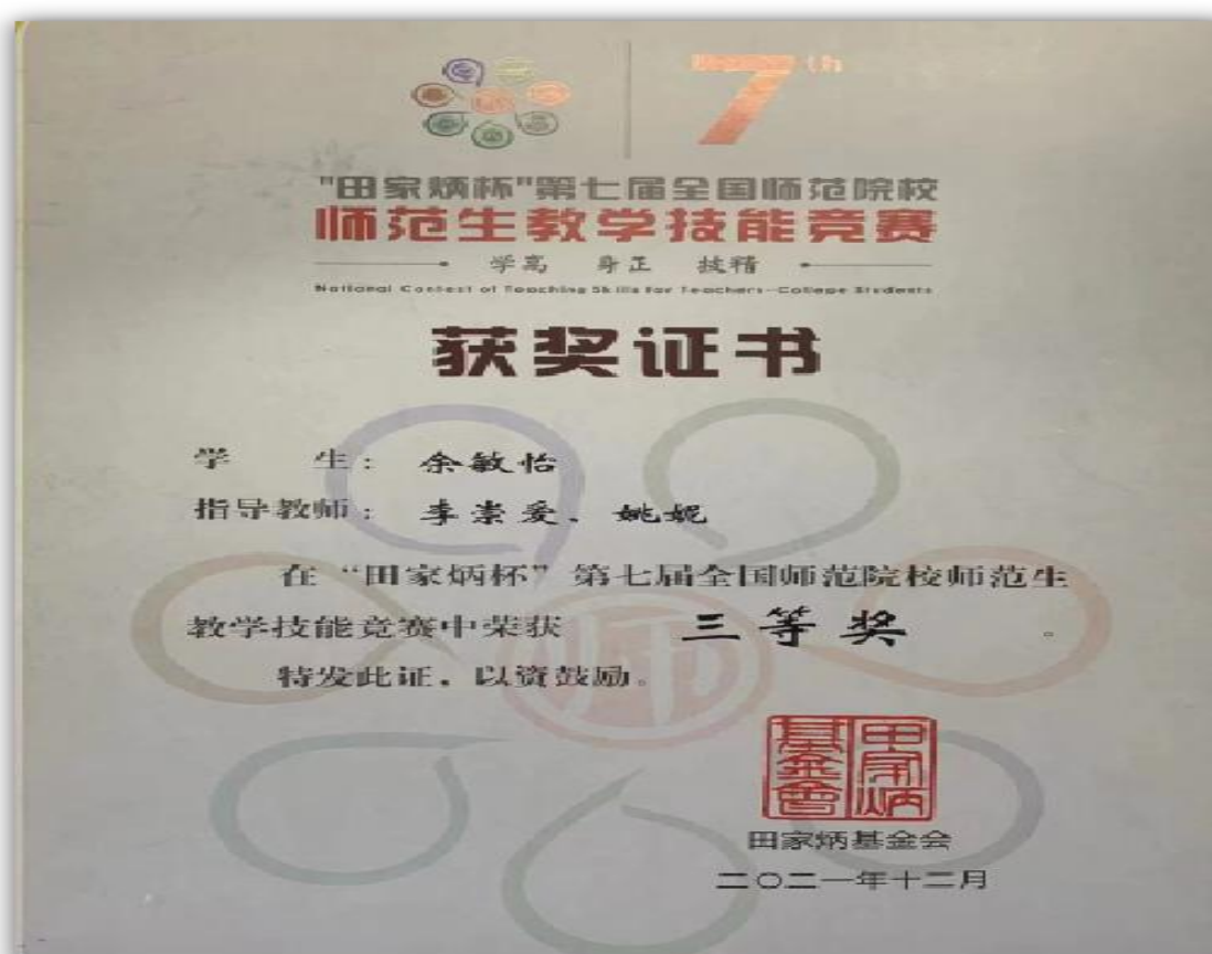
图四 马克思主义学院学生师范教学技能竞赛部分获奖展示