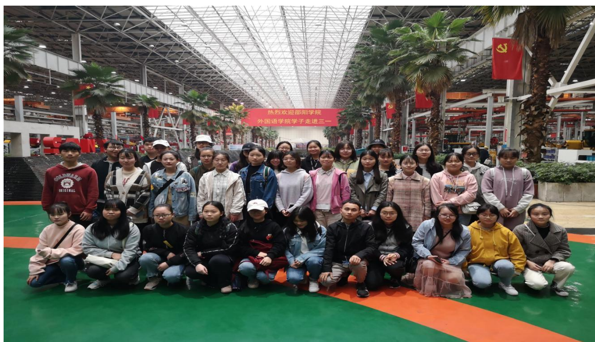
(外国语学院学生在三一重工长沙总部见习)