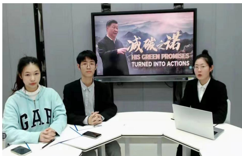
（外国语学院学生参加全国商务英语实践技能大赛获全国三等奖）