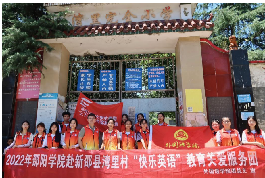
(2022年暑假外院学子赴新邵县湾里村开展支教活动)